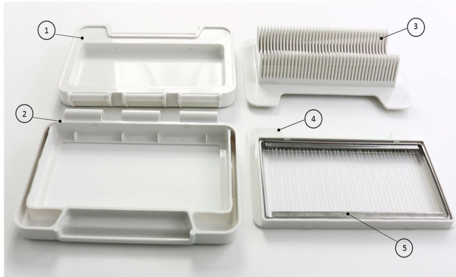
Figura Slicer Professional – Piezas individuales