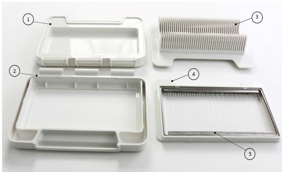
Abb. Slicer Professional – Einzelteile

Datum: 03. Februar 2021 Index: 01-DE Author: G. Hoenen